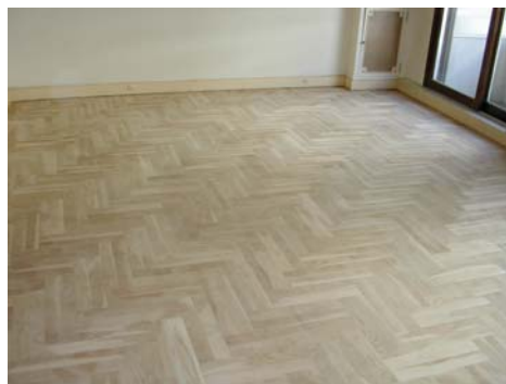
PONCAGE - REPLANISSAGE