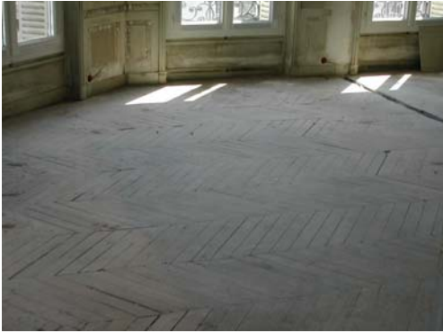
ETAT DE DEPART