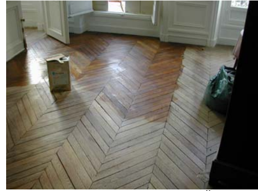
APPLICATION DE CIRE SUR CHÊNE

L' autre finition réalisable est l'application de cire ou d'huile pour parquets. Ces produits, dits d'imprégnation, offrent l'agrément de retraiter facilement une partie de la surface. D'autre part, ils ne filment pas à la surface du bois et laissent l'aspect naturel du bois.