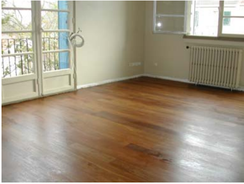
HUILAGE SUR BOIS EXOTIQUE