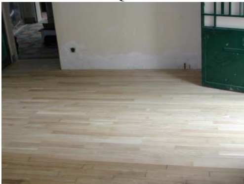
RACCORD DE PARQUET NEUF