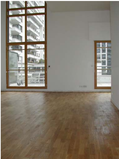
VITRIFICATION ASPECT SATINE