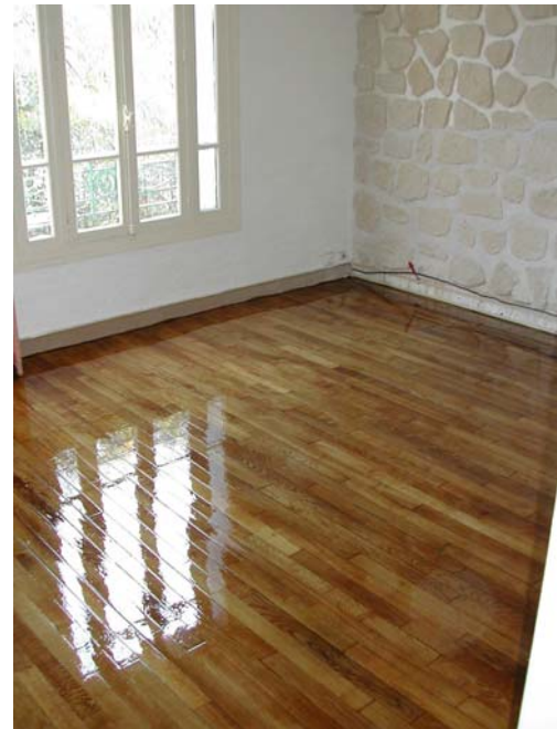
VITRIFICATION ASPECT BRILLANT

La vitrification est la finition la plus répandue car elle permet un entretien très simple et assure une parfaite protection pour le bois. Elle se décline en plusieurs aspects : brillant, satiné et mat.