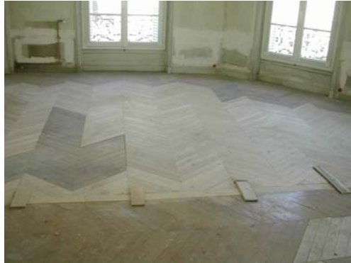
REPLACEMENT LAMES ABIMEES