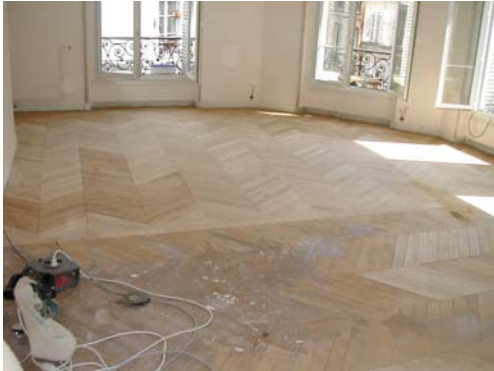
RACCORD DE PARQUET NEUF