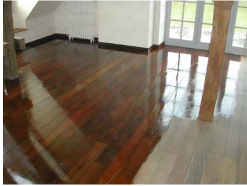
HUILAGE SUR BOIS EXOTIQUE