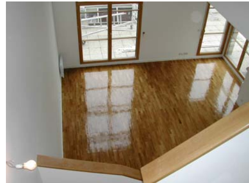
VITRIFICATION ASPECT BRILLANT