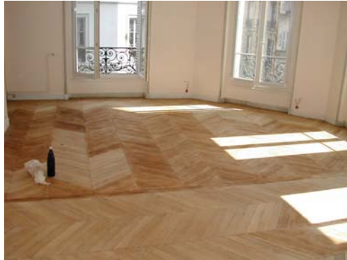
MISE EN TEINTE