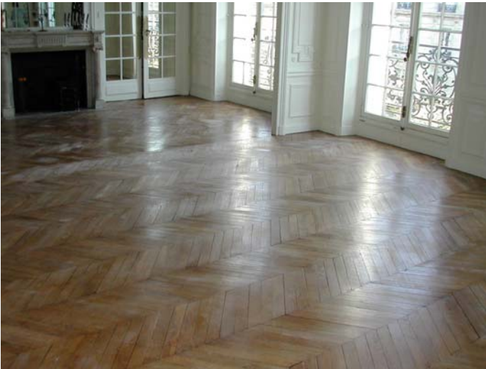
APRES PREMIERE COUCHE ET EGRENAGE