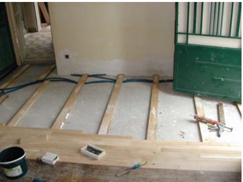
FIXATION DES LAMBOURDES