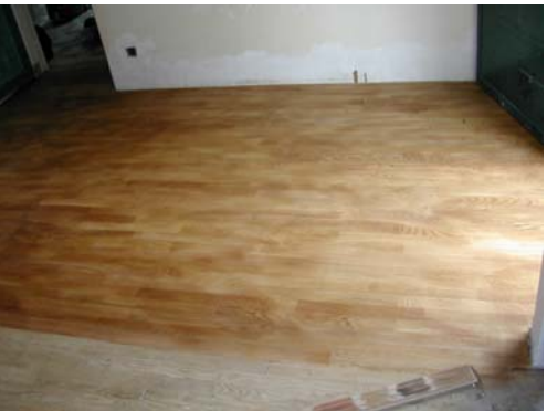
MISE EN TEINTE