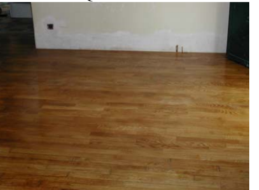
RESULTAT APRES VITRIFICATION