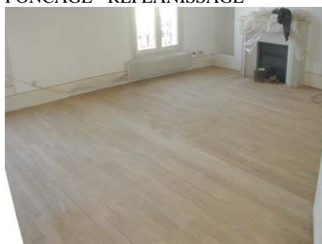
PONCAGE - REPLANISSAGE