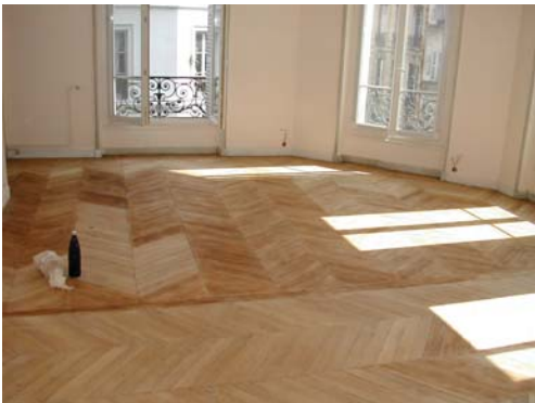
MISE EN TEINTE DES LAMES NEUVES