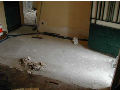
ETAT DE DEPART