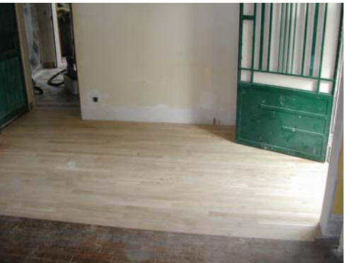
POSE DU PARQUET