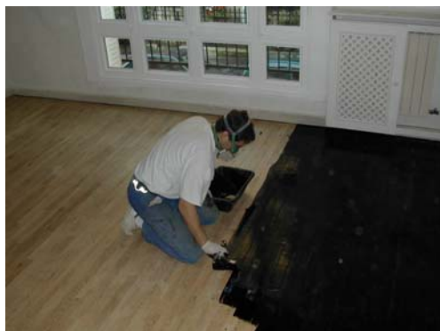
MISE EN TEINTE TOTALE