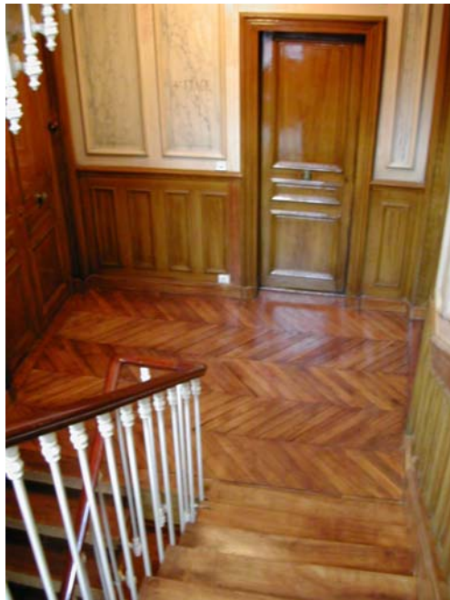
VITRIFICATION ASPECT SATINE