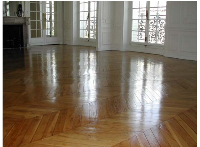
APRES DEUX COUCHES DE VITRIFICATEUR SATINE

Entre les couches successives de vitrificateur, l'egrenage permet de garantir un meilleur accrochage du produit et une finition impeccable