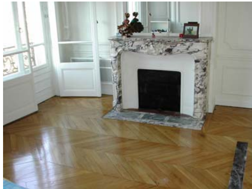
VITRIFICATION ASPECT SATINE