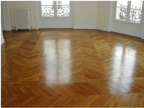
VITRIFICATION ASPECT SATINE