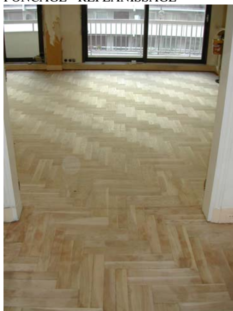
PONCAGE - REPLANISSAGE